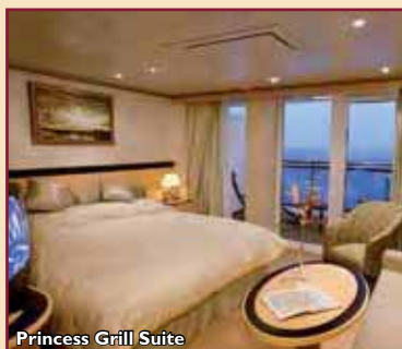
Princess Grill Suite